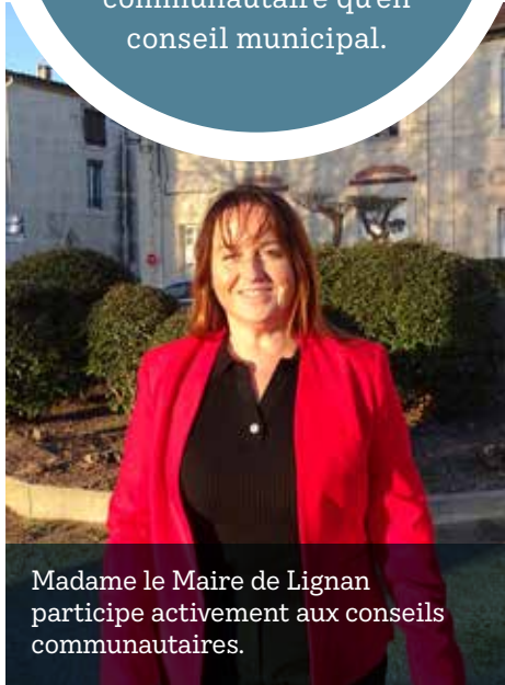
Madame le Maire de Lignan participe activement aux conseils communautaires.

Le Président de l'Agglomération a demandé au directeur de formaliser une rencontre avec Madame le Maire de Lignan. ■